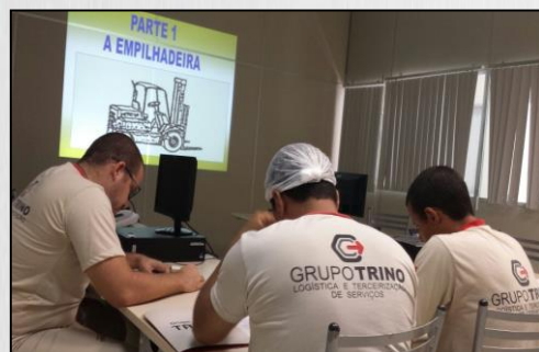
Curso de Reciclagem de Empilhadeiras realizado pelo Grupo Trino.

Entre julho e agosto de 2016, o Grupo Trino realizou curso de reciclagem para 31 operadores de empilhadeira que prestam serviços de logística no setor alimentício, químico e indústria vidreira.