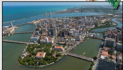
Pontes do Recife.

A cidade do Recife é conhecida para muitos como a Veneza Brasileira por causa de sua paisagem cortada por rios, canais e por várias pontes que interligam os bairros. Construídas com materiais e estilos arquitetônicos diferentes, as pontes constituem um rico acervo do patrimônio material e histórico de Pernambuco. Inaugurada em 1863 a ponte Princesa Isabel foi a primeira construída em ferro. A ponte 06 de Março foi construída na época de Nassau e reconstruída em 1921. A ponte Duarte Coelho atendia aos serviços ferroviários inaugurados em 1868. A Do Limoeiro data de 1881 e serviu ao trem que saía da velha estação do bairro do Brum. A ponte Boa Vista foi concluída em madeira em apenas sete semanas, no ano de 1644. A Maurício de Nassau foi a primeira ponte do Brasil, datada de 1644. A Buarque de Macedo data de 1890 e é a mais extensa ponte do centro do Recife (283,3m). A ponte 12 de Setembro , antiga ponte Giratória por ser originalmente móvel, foi construída em 1923 e substituída por uma estrutura fixa em 1971.